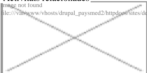
image not found file:///var/www/vhosts/drupal_paysmed2/httpdocs/sites/default/files/styles/recherche/public/Images/Monument/St%20Laurent-ND%20Sort.jpg