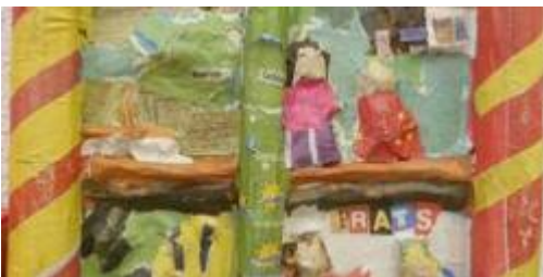
L'art des retables : Raconte-moi l'histoire de Sant Jordi

Grâce à des collages et dessins, les élèves appréhendent la fonction narrative d'un retable.