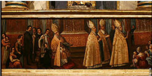
L'art des retables : Raconte-moi un retable baroque

A l'occasion de la visite guidée d'une église, les élèves sont amenés à observer plus particulièrement un retable baroque, sa composition et sa typologie.