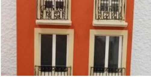
Création d'une façade par collage

Les enfants réalisent leur propre façade en collant des éléments architecturaux et des observés lors d'une visite-découverte et/ou dans leur environnement urbain.