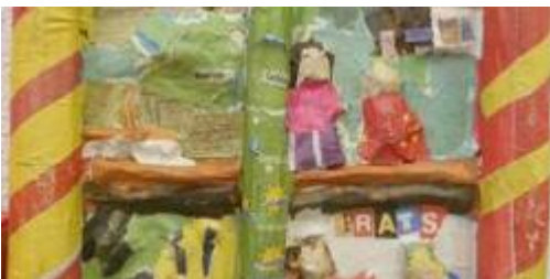
L'art des retables : Raconte-moi l'histoire de Sant Jordi

Grâce à des collages et dessins, les élèves appréhendent la fonction narrative d'un retable.